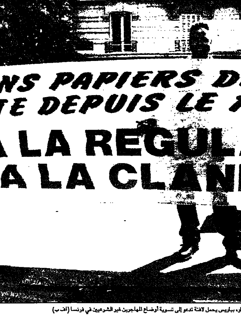
أحد المهاجرين للعثاقين في كيبس، سان بيريتر، بربلس يحمل لافتة تدعو إلى تسمية أوضاع المهاجرين غير الشرعيين في فرنسا